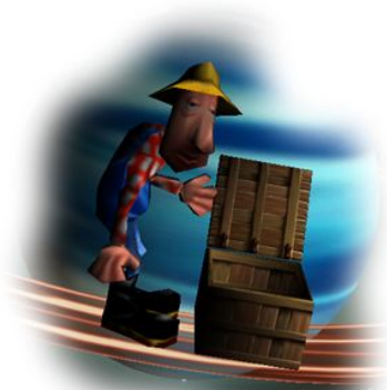
Ripristina partita salvata