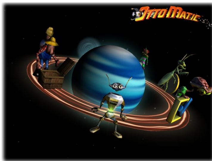
Il menu principale

Utilizzare i tasti freccia sinistra/destra e la barra spaziatrice per selezionare le opzioni del menu principale: