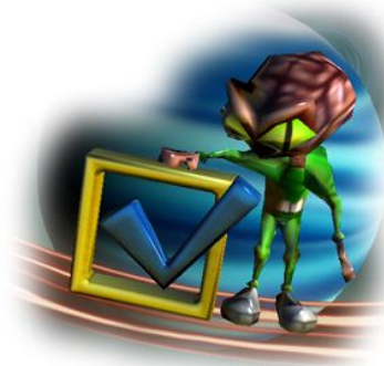
Impostazioni e controlli